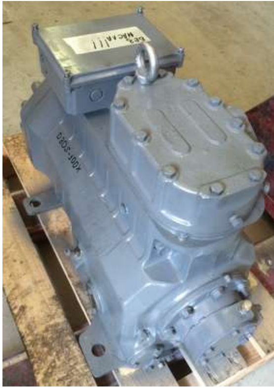
ФОТО КОМПРЕССОРА D3DS5-100X-AWM (сер.№ Б/Н)