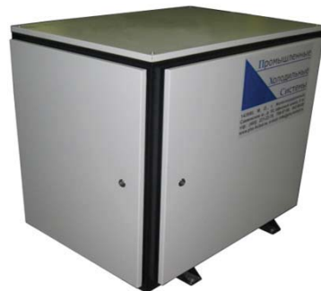
С компрессором Вокс HGX34