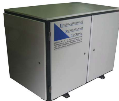
С компрессорами Вокс HGX34.