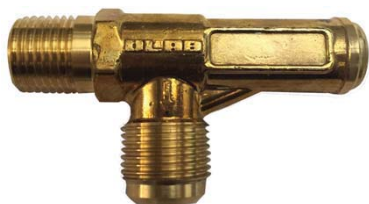
Серия 40 - угловой