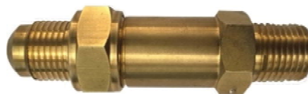
Серия 41 - прямоточный