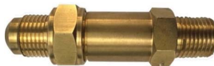
Серия 41 - прямоточный